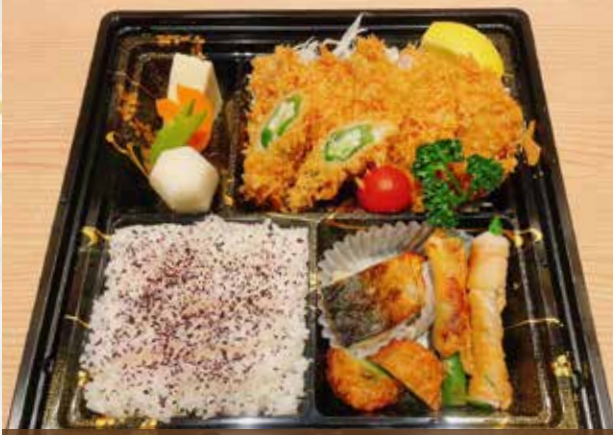
まるやローズかつ弁当