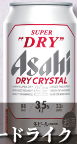
アサヒ スーパードライクリスタル