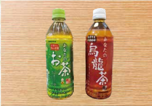
ドリンク(緑茶・烏龍茶)