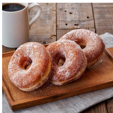
ふんわり7穀のシュガードーナツ