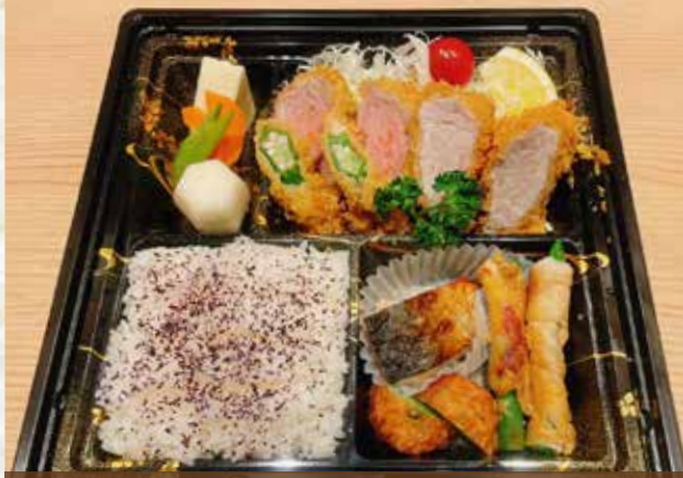
まるやヒレかつ弁当