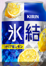
麒麟 氷結 シチリア産レモン