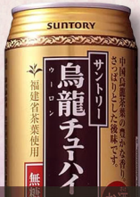
サントリー 烏龍チューハイ