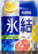
麒麟 氷結 グレープフルーツ