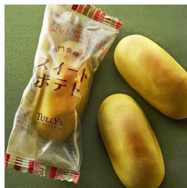
鳴門金時のスイートポテト ¥236