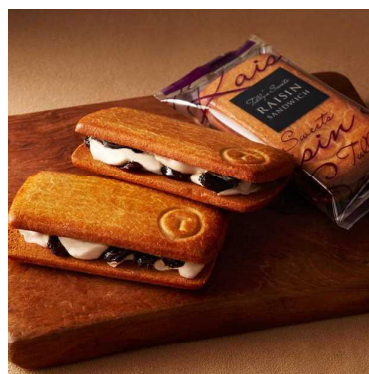
タリーズレーズンサンド ¥250