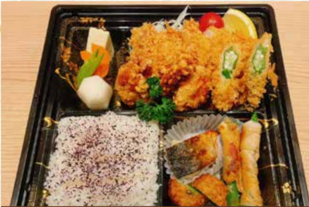
まるやローズかつ盛合せ弁当 (ローズかつ、唐揚げ)