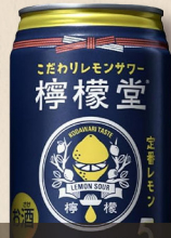
コカ・コーラ 檸檬道 定番レモン