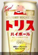
サントリー トリス ハイボール