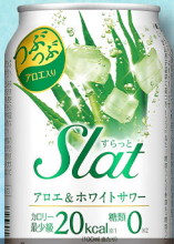
アサヒ Slat アロエ&ホワイトサワー