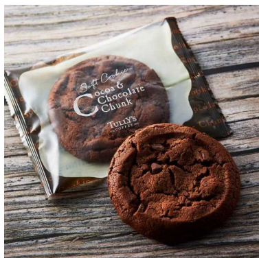
ソフトクッキー ココア&チョコレートチャンク ¥216