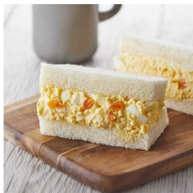
たっぷりタマゴサンド