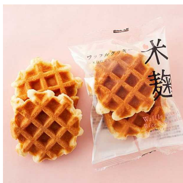
ワッフルクッキー ~米麴仕立て~ ¥236