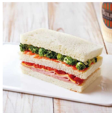
ハムチーズ&サラダサンド