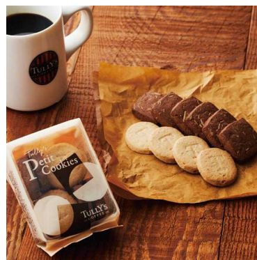
タリーズプチクッキー アーモンドココア&シナモン ¥358