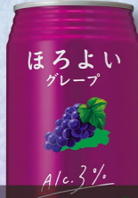
サントリー ほろよい グレープ