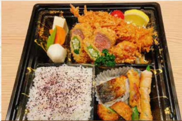
まるやヒレかつ盛合せ弁当 (ヒレかつ、唐揚げ、海老フライ)