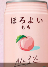
サントリー ほろよい もも