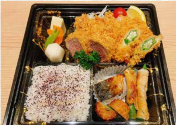
まるや盛合せ弁当(ローズかつ、ヒレかつ)