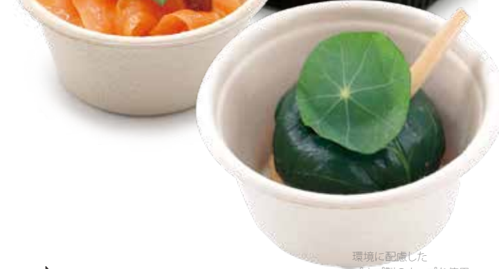
環境に配慮した パルプ製のカップを使用

全てのお料理を1人前ずつ取りやすい蓋つきのカップに盛りつけてビュッフェスタイルでご提供する、 カップフードビュッフェ 。小分けになっているので、ゲストがお料理を取り分ける手間がなく、蓋つきなので乾燥や異物混入を防ぐこともできるので、長時間のご提供も安心。