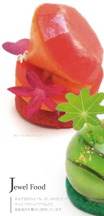
赤ピーマンのムースリング